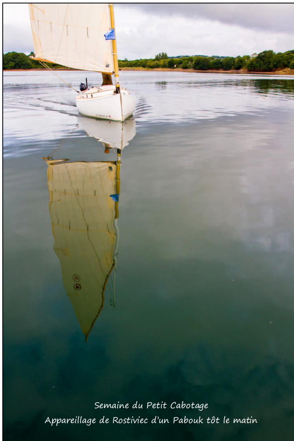
Semaine du Petit Cabotage Appareillage de Rostiviec d'un Pabouk tôt le matin

www.cnrostitiviec.com - cnrostitiviec@cnrostitiviec.com